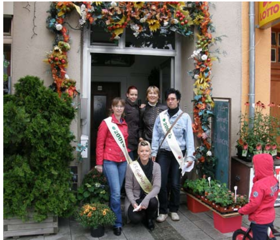
Verleihung des zweiten Preises an das „Blumenhaus Veronica“ der Berliner Str. 4b.

Regelmäßig erscheinende Zeitung zur Revitalisierung der Gubener Innenstadt